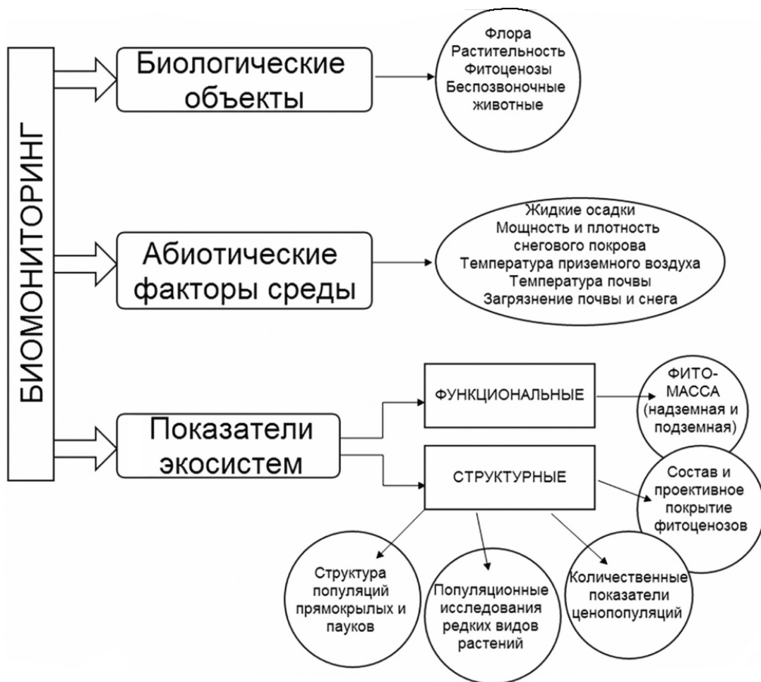
Рис.1. Схема экологического мониторинга с использованием биологических индикаторов состояния окружающей среды

Абиотические параметры: количество жидких осадков в вегетативный период; мощность, плотность, влагозапас снегового покрова; динамика температуры приземного воздуха; динамика температуры приповерхностного слоя почвы; загрязнение почвы и снега.